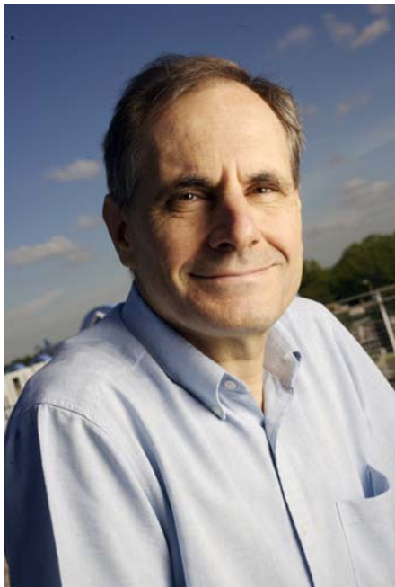
Portrait de Jean Weissenbach